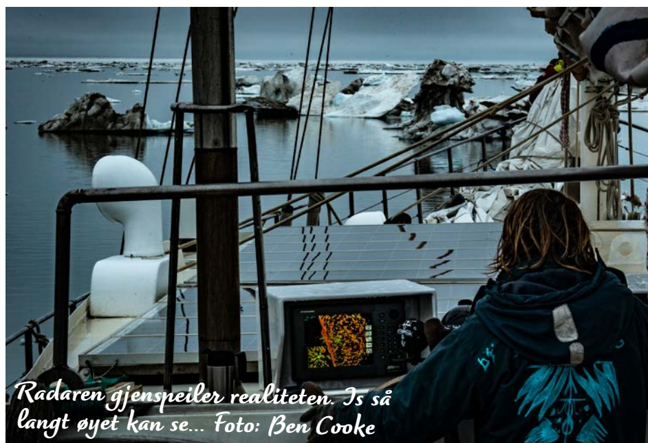
Radaren gjenspeiler realiteten. Is så langt øyet kan se...