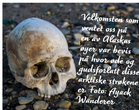
Velkomsten som ventet oss på en av Alaskas øyer var bevis på hvor øde og gudsførlatt disse arktiske strøkene er.

hele tiden vært optimistisk og prøvd i det lengste, nå ble han lang i maska. Første steg var å fortelle det til familien hans. Partneren hans hadde simpelthen elsket livet i tropene. Nå så hun med gru for seg en bitende kald overvintring i polstrøkene – uten sentralfyring ombord. Vinterstid kryper gradestokken gjerne ned til minus 40°–50°, av og til -60 ° celsius. Akkurat nå lå temperaturen på 4°C i lugarene, noe som