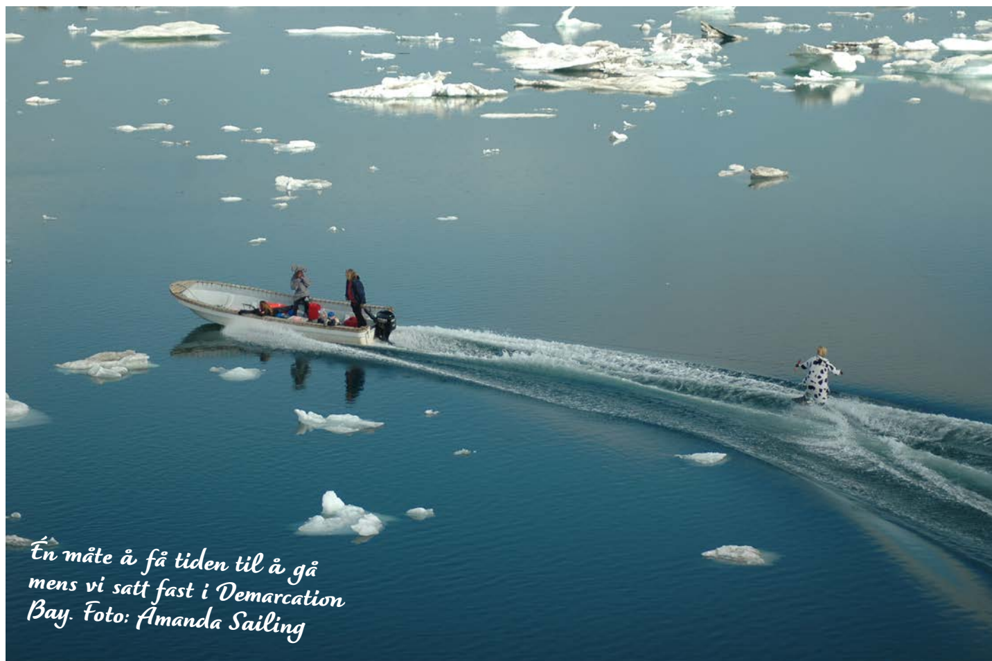
En måte å få tiden til å gå mens vi satt fast i Demarcation Bay.