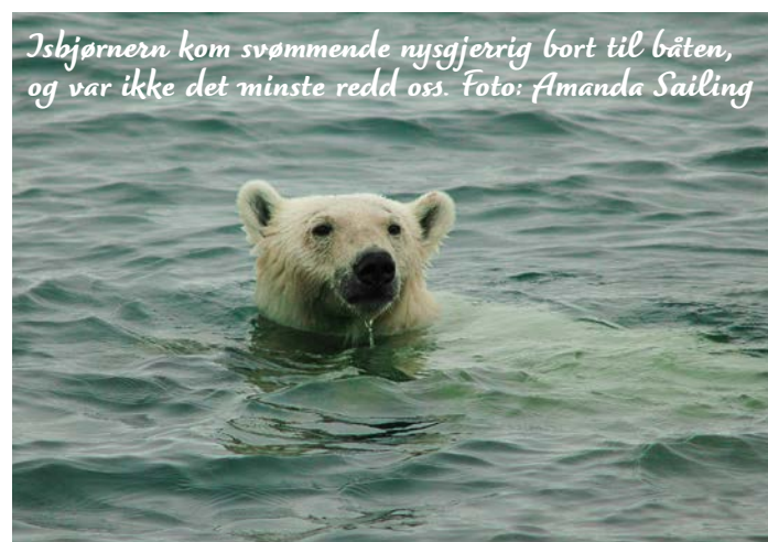
Isbjørnerna kom svømmende nysgjerrig bort til båten, og var ikke det minste redd oss.

Etter tre uker kom vi oss endelig videre. Herschel Island kunne allerede skimtes på horisonten før isen for alvor begynte å lukke seg rundt oss. Nå gjaldt det å få fortgang på sakene. Mens vakthavende fortøyde til isen, hentet andre fram overlevelses- og våtdrakter. Neida, tiden var ikke inne for å forlate båten for godt, slik som mannskapet på "Anahita", som måtte evakueres med helikopter. Vi skulle isteden innta isbjørnens territorium til fots. Så snart trossene var på plass, forsvant en patrulje over rekka. Isen ble definert som bunnsolid, og vi andre lot oss ikke be to ganger om å tre ned på selveste polarsisen. Veien hit hadde vært kronglete, og innimellom hadde vi